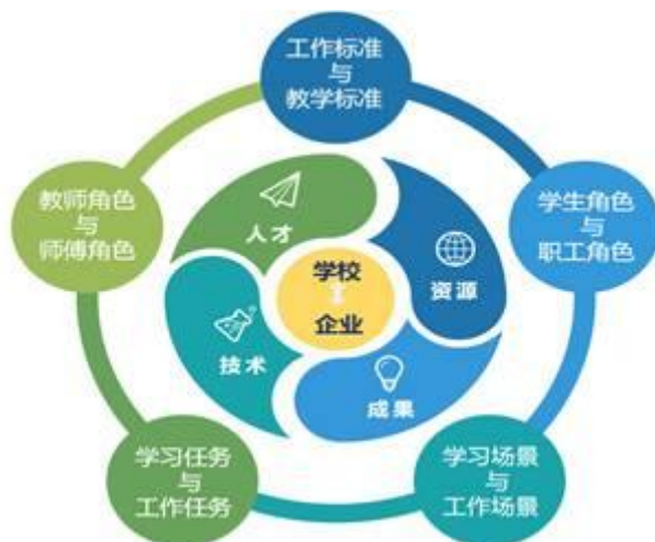
图1 “双主体四共享五融合”人才培养模式

色、教师角色与师傅角色的“五融合”协同育人举措，递进提升学生的“基本素养-创新素养-创新能力”，共育“懂生活”“爱工作”的“双高品质”技术技能人才。